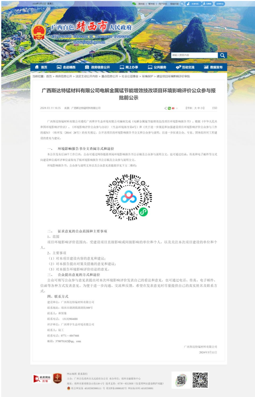
图 5 报批稿全文网络公示截图