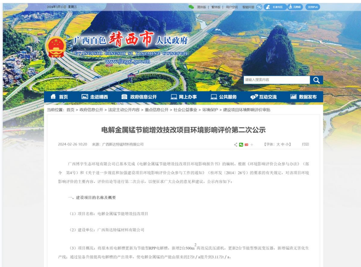
图 2 征求意见稿全文网络公示截图 2