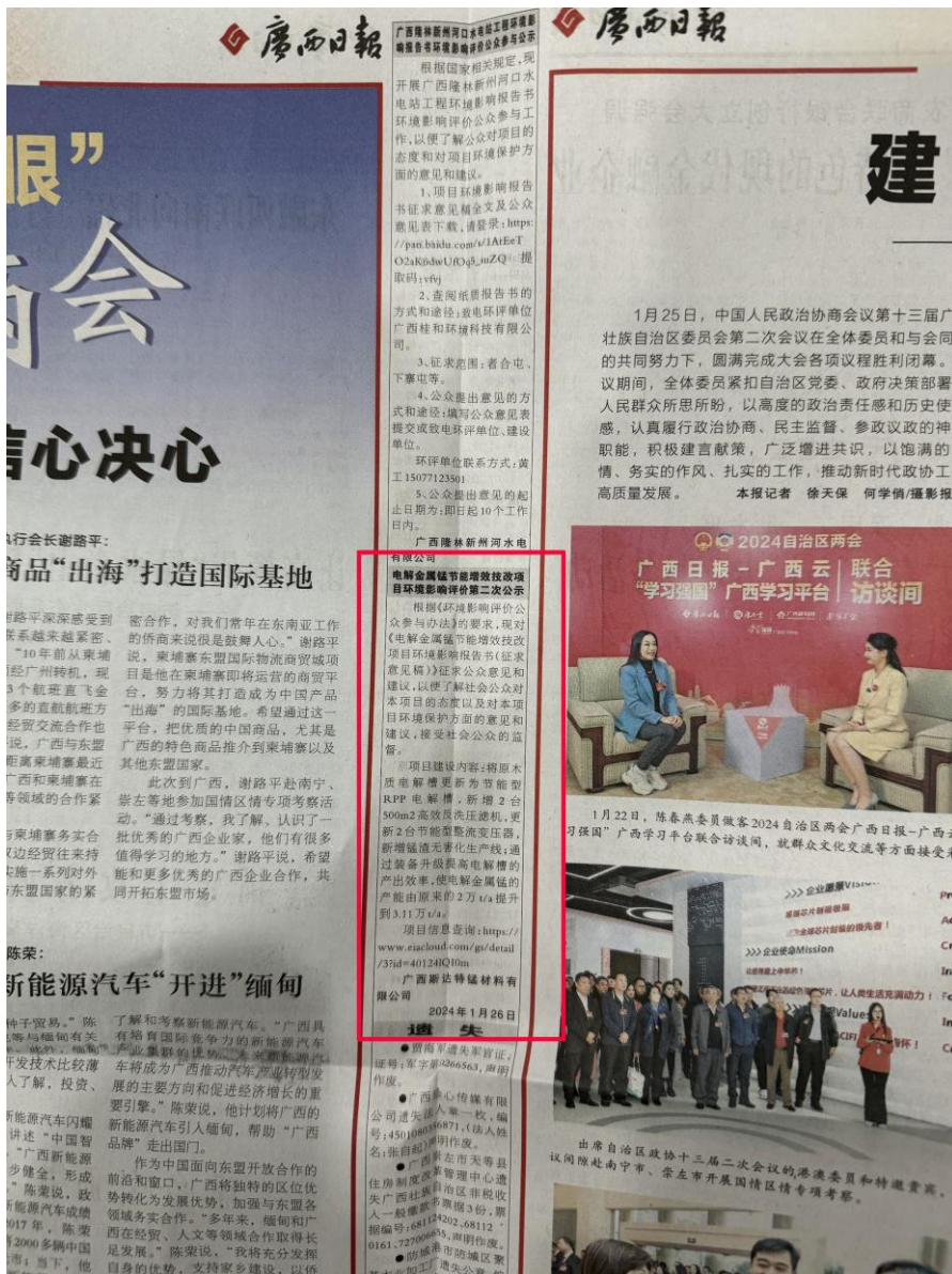
图3 第一次登报公示照片

本项目环境影响报告书征求意见稿形成后，于2024年1月26日、2024年1月27日在广西日报进行了2次登报公示。《广西日报》是一张综合性、开放型的报纸，其内容丰富多彩，为广大读者所喜闻乐见，逐步成为市民百姓的良朋益友和不可或缺的精神食粮，在广西拥有众多读者。符合《环境影响评价公众参与办法》“通过建设项目所在地公众易于接触的报纸公开，且在征求意见的10个工作日内公开信息不得少于2次”的要求。公示内容详见下图。