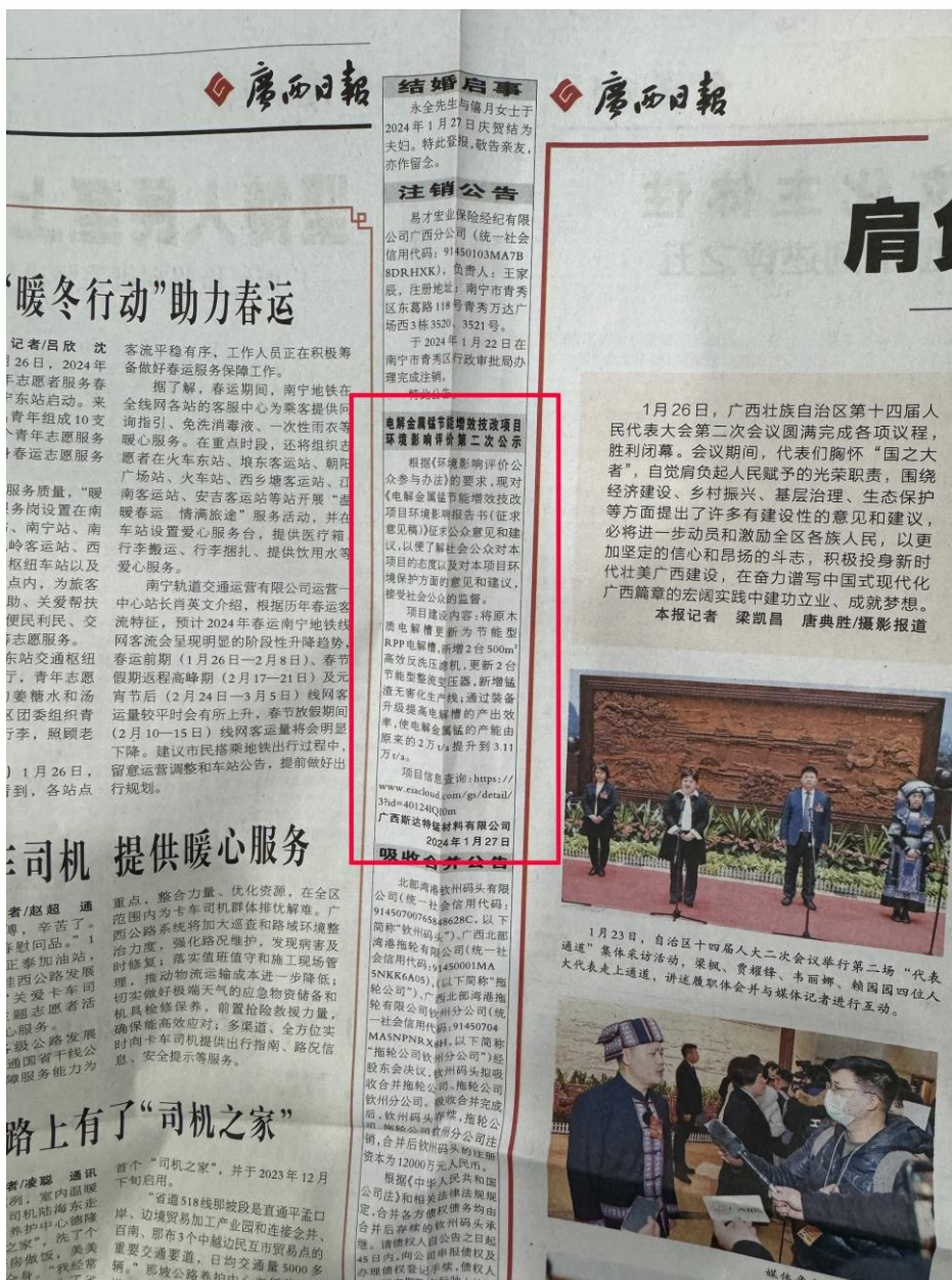
图 4 第二次登报公示照片